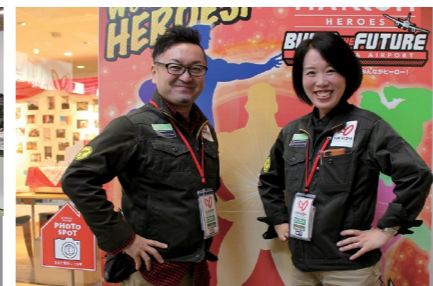
八光建設には優しく、時には厳しくいろいろ教えてくれる先輩がいます!