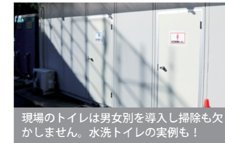
現場のトイレは男女別を導入し掃除も欠かしません。水洗トイレの実例も!