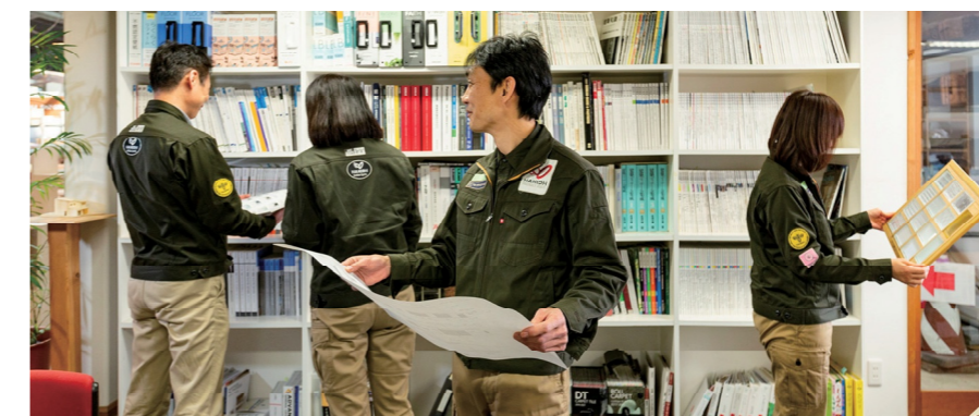
どの年代が着ても似合うカッコいいユニフォームを目指しました。

こんな風に職場をアップデートして若い世代にも楽しんで働いてもらえる会社づくりをしています