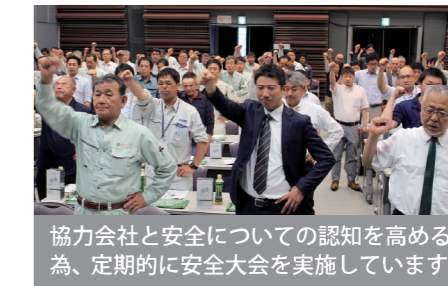
協力会社と安全についての認知を高める為、定期的に安全大会を実施しています。