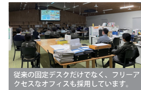
従来の固定デスクだけでなく、フリーアクセスなオフィスも採用しています。