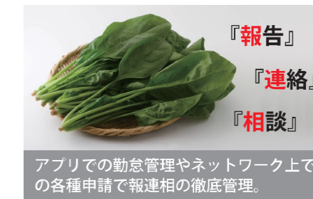
アプリでの勤怠管理やネットワーク上で各種申請で報連相の徹底管理。