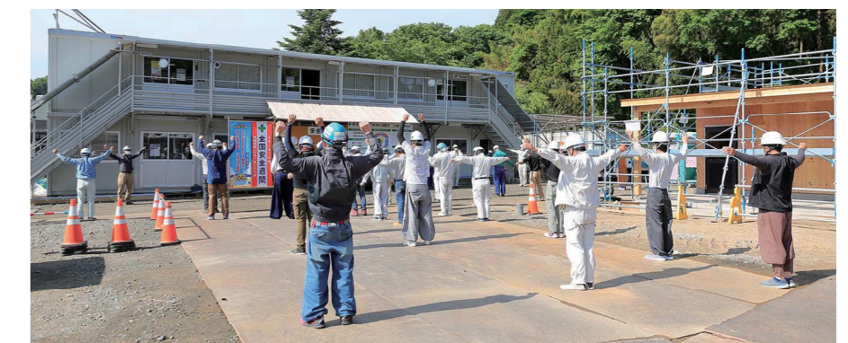
毎朝の朝礼にて、安全注意事項、作業内容、共有事項の伝達を必ず行います。